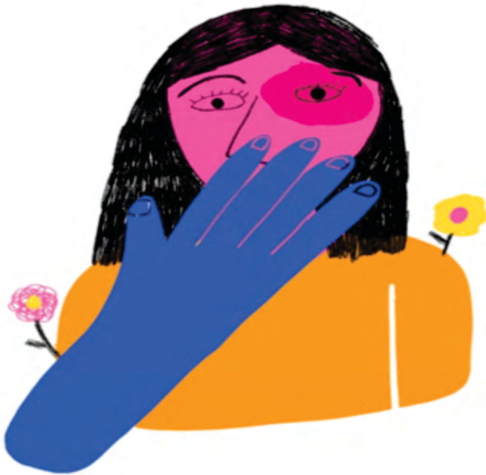
Figura 1. Violencia de Género.